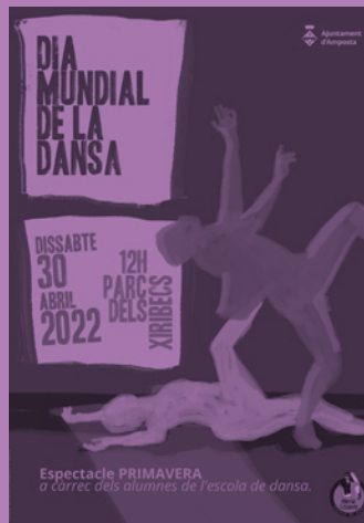
Espectacle PRIMAVERA a càrrec dels alumnes de l'escola de dansa.

Food trucks Dia internacional de la dansa Dia mundial del circ