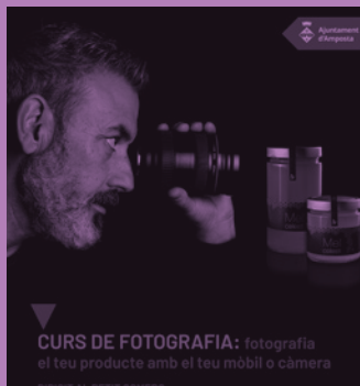
CURS DE FOTOGRAFIA: fotografia el teu producte amb el teu mòbil o càmera

Cal indicar si es portarà mòbil, càmera o tots dos. Places gratuïtes limitades