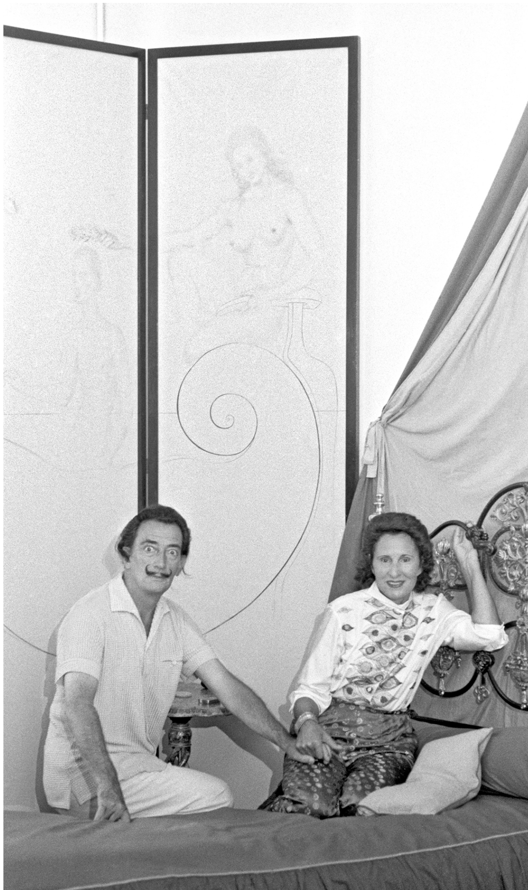
Robert Descharnes. Salvador Dalí i Gala a casa seva a Portlligat, 1958 Foto R. Descharnes / © Descharnes & Descharnes sari 2024. Drets d'imatge de Salvador Dalí i Gala reservats. Fundació Gala-Salvador Dalí, Figueres, 2024.