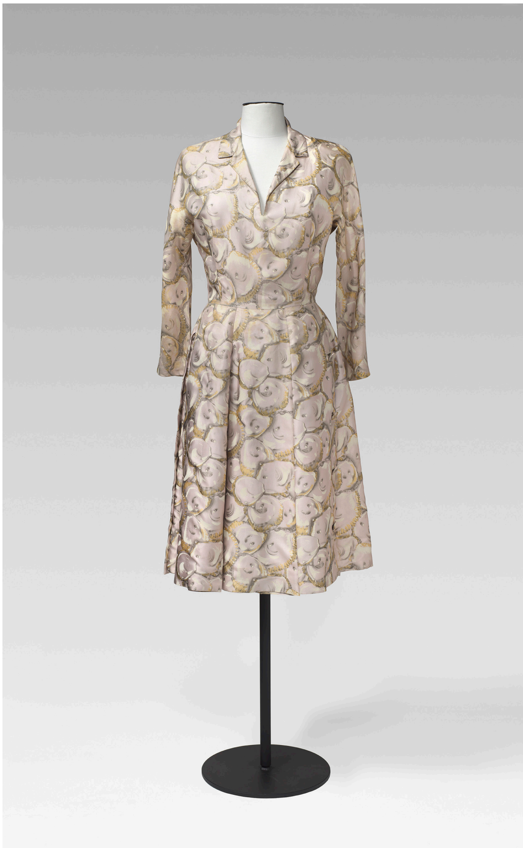
Hubert de Givenchy (París) Vestit de còctel, c. 1952