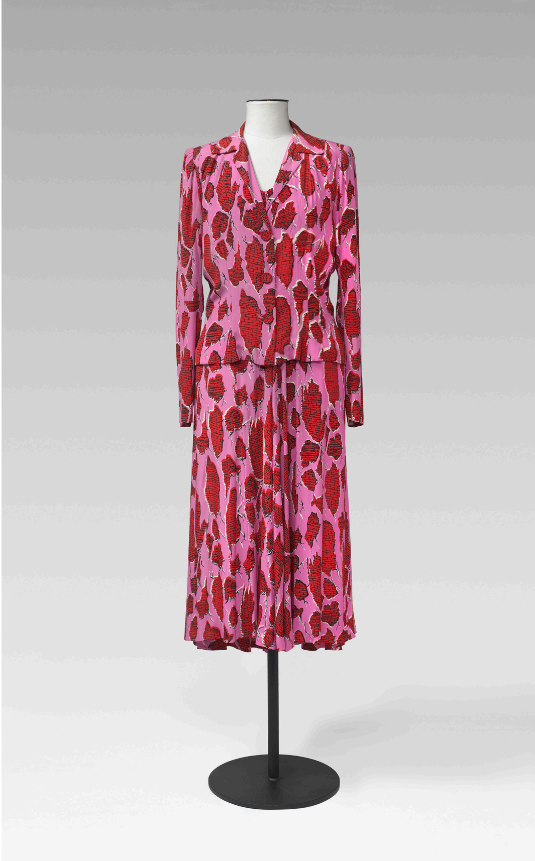
Vestit i jaqueta a joc amb estampat trompe-l'oeil per Salvador Dalí, c. 1948