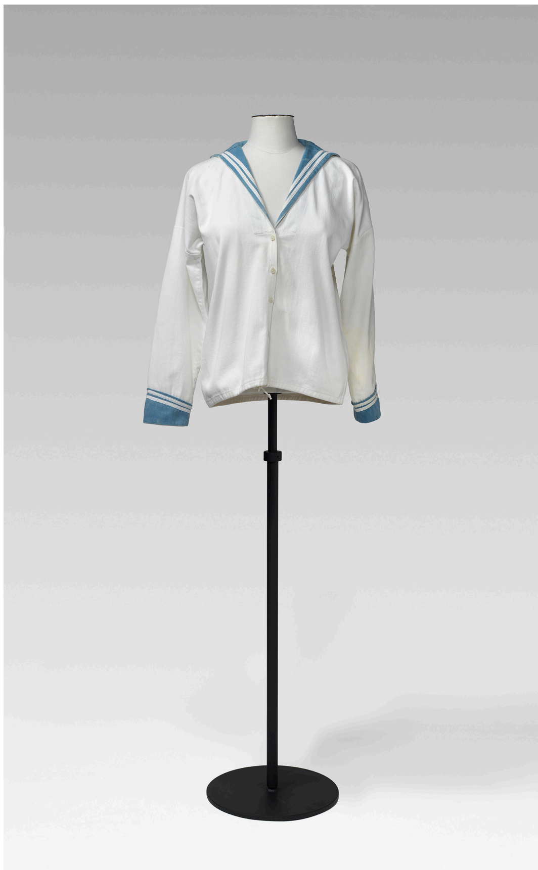
G. Sinigaglia (Venezia). Mariniera, 1950s