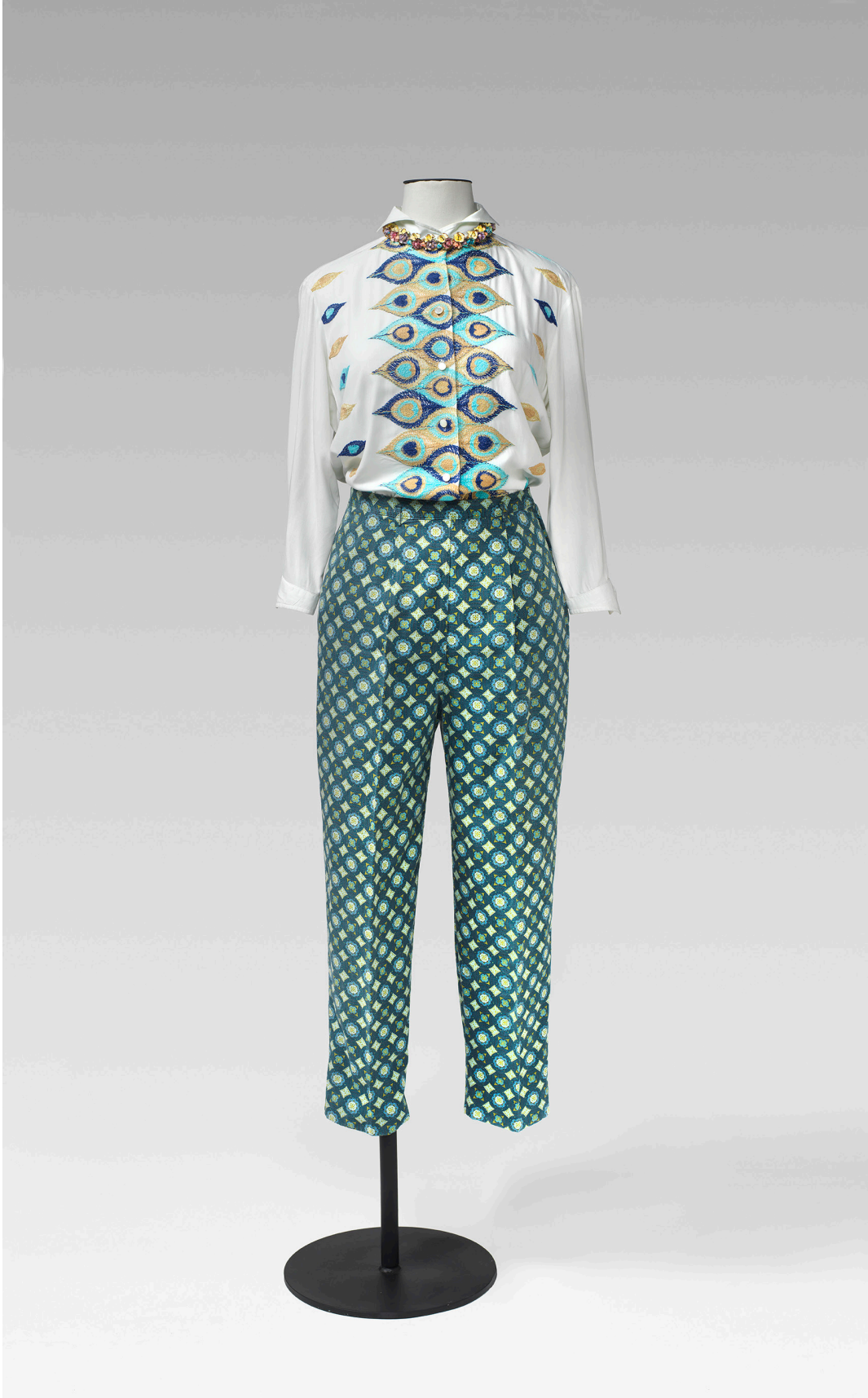
Oleg Cassini (New York). Brusa, c. 1958. White Stag (Portland). Pantalons, 1950s. Collaret amb flors d'esmalt, s. XX