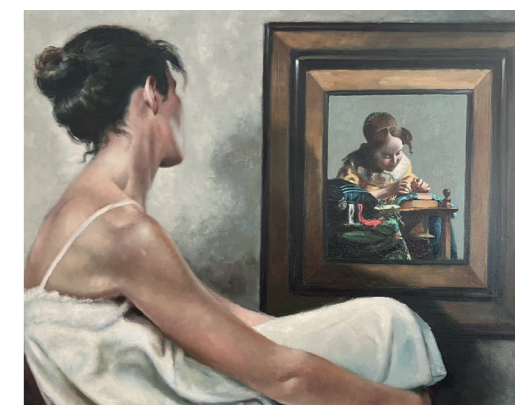
Josep Lluís Arimany Figura ,1975 Oli sobre tela 92 x 73 cm

Les seves obres vibren en una atmosfera tranquil·la i professen una bellesa i alguns grams de misteri que conviden a un diàleg visual i a l'expressió de sentiments a flor de pell.