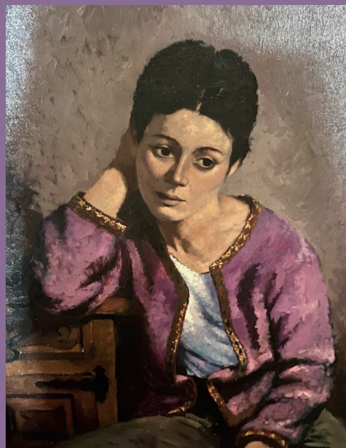
Josep Lluís Arimany Figura en lila , 1980 Oli sobre tela 81 x 60 cm

El Museu de Granollers vol agrair a la família de Josep Lluís Arimany la seva predisposició i col·laboració en la realització d'aquesta exposició.