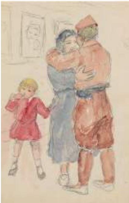
Marxant al front. Llorens. Llapis i aquarel·la s/p, 20,5 x 13,5 cm.