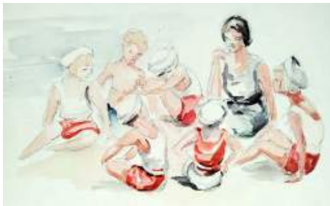
Dona amb infants a la platja. Llapis i aquarel·la s/p, 15,5 x 23,5 cm.