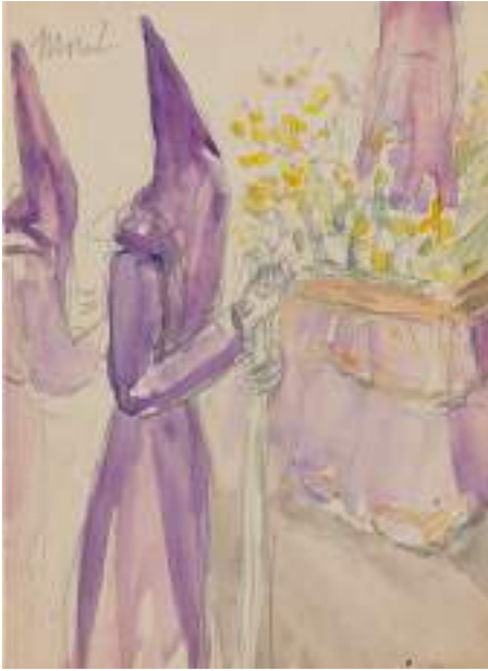
Penitent, "Morat". Llapis i aquarel·la s/p, 17 x 12,5 cm.