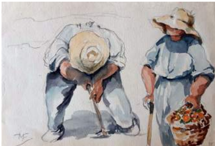
Treballant el camp III. Llapis i aquarel·la s/p. 12,5 x 20 cm. Museu de Valls.