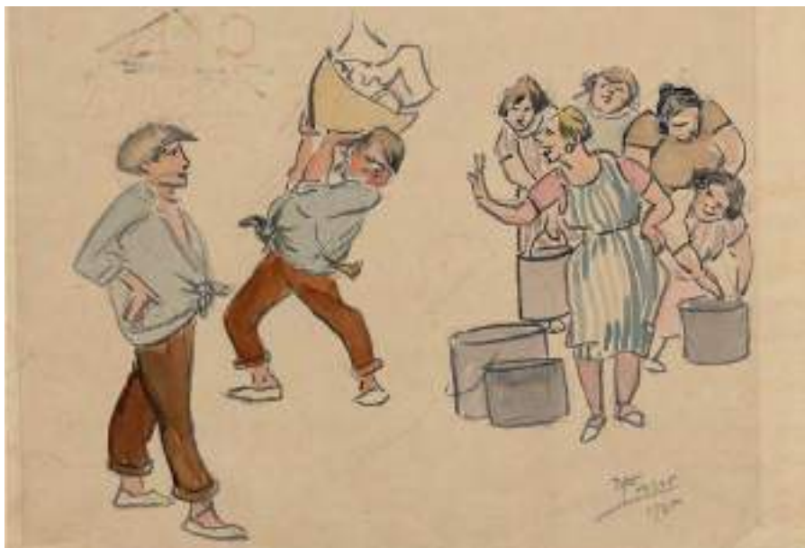
L'escombriaire , 1935. Llapis i aquarel·la s/p, 24 x 31 cm.