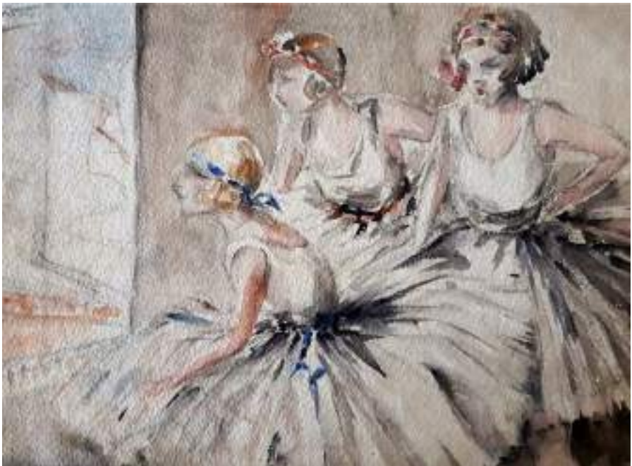
Ballarines esperant per sortir a l'escenari, "Grup I". Llapis i aquarel·la s/cartolina, 30 x 48,5 cm.

L'artista va deixar un complet testimoni gràfic de la vida musical del moment, tant dels concerts del Palau de Música Catalana, com de les òperes i els ballets del Gran Teatre del Liceu. Les notes escrites al marge i les col·leccions de programes ens ajuden, en molts casos, a identificar l'espectacle i els artistes. Entre tots els dibuixos, destaquen els meravellosos apunts de les actuacions dels ballets russos i les sèries dedicades a les ballarines, a les classes de dansa o en els moments d'esbarjo.