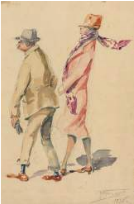
Visitant Barcelona, 1926. Llapis i aquarel·la s/p, 29, 5 x 23 cm.

La mirada de l'artista sovint se centrava en persones anònimes de totes les classes socials, també les més marginades, músics ambulats o persones de raça gitana. Per la roba i els atuells dels personatges, endevinem les escenes: les dones que tornen del mercat, turistes, dones cosint o jugant a cartes, traginers, la vida de la taverna; sempre amb una mirada entre tendra i irònica.