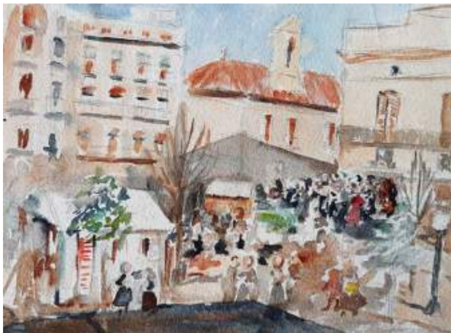
Fira al Pati. Llapis i aquarel·la s/p, 21,4 x 26 cm. Museu de Valls.