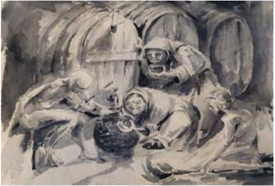
Bruixots al celler. Tinta negra s/p, 23,5 x 31 cm.