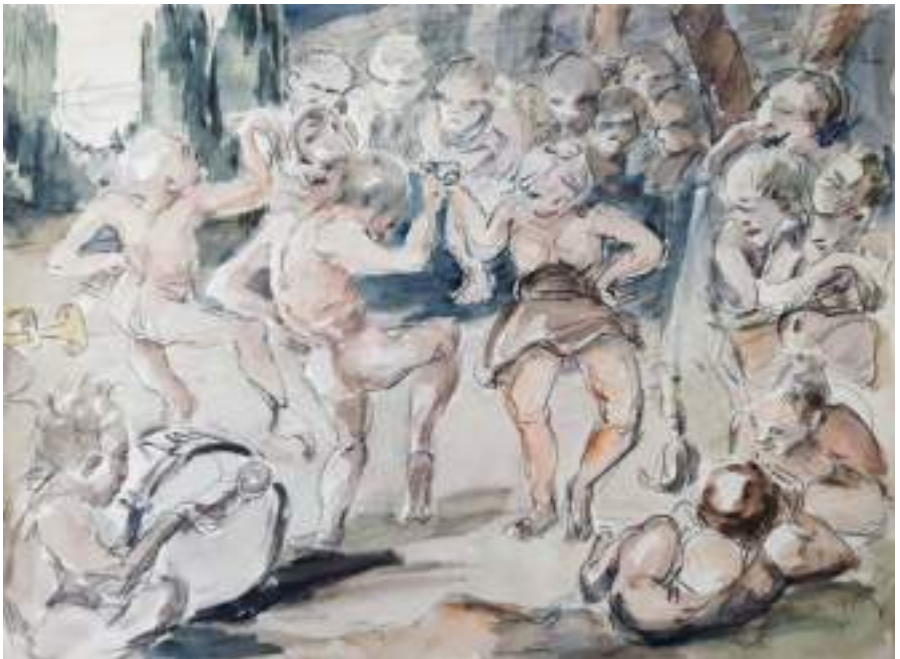
Dansa de bruixes i bruixots. Llapis i aquarel·la s/p 24,5 x 32 cm.