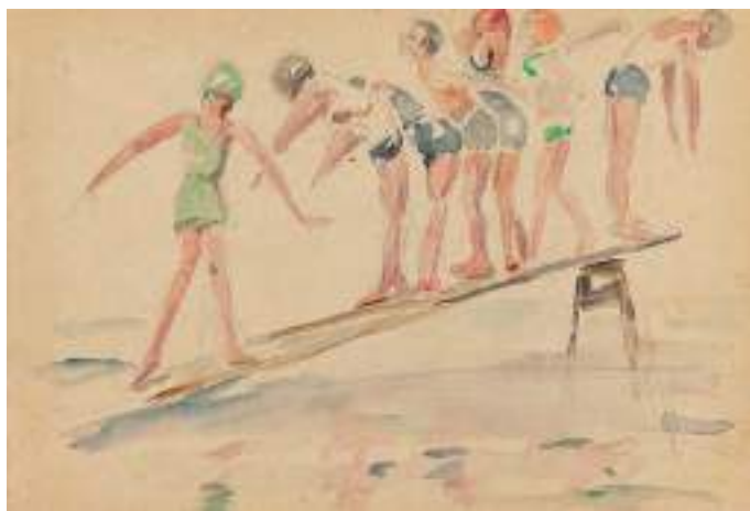
La palanca dels Banys d'en Cintet. Llapis i aquarel·la s/p, 16 x 23,5 cm.

Els estius, passats a la casa familiar de Ca la Duana, li van servir per deixar un repertori molt extens de notes ràpides de la gent gaudint de la platja, fent esports de mar, jugant a pilota o, simplement, descansant i relacionant-se a prop del mar. És la sèrie de dibuixos en els quals la infància està millor representada, sempre amb una gran sensibilitat.