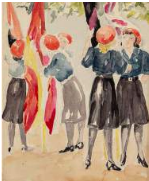
Noies carlines, les margarites. Llapis i aquarel·la s/p, 18 x 13,5 cm.