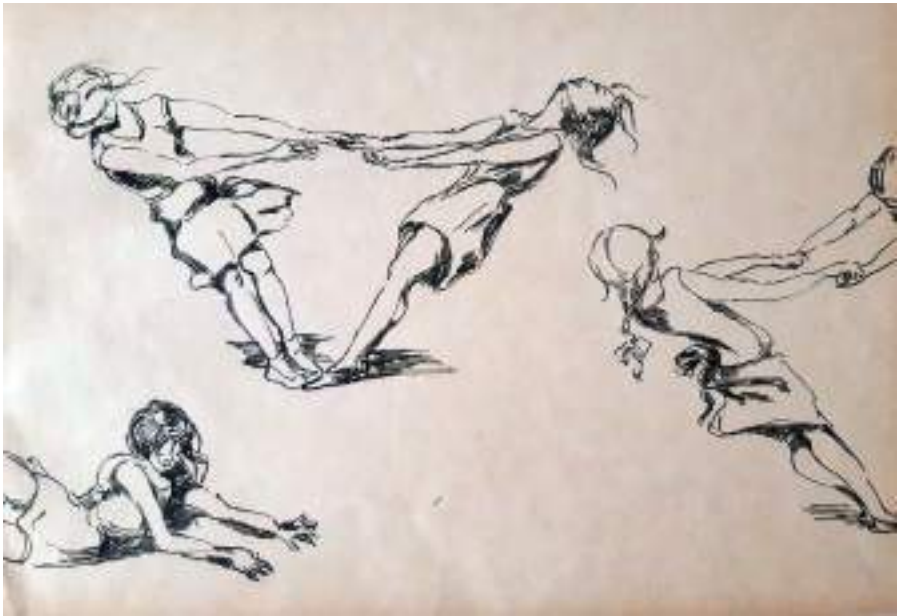
Nenes jugant. Llapis i tinta s/p, 23,3 x 30,7 cm.