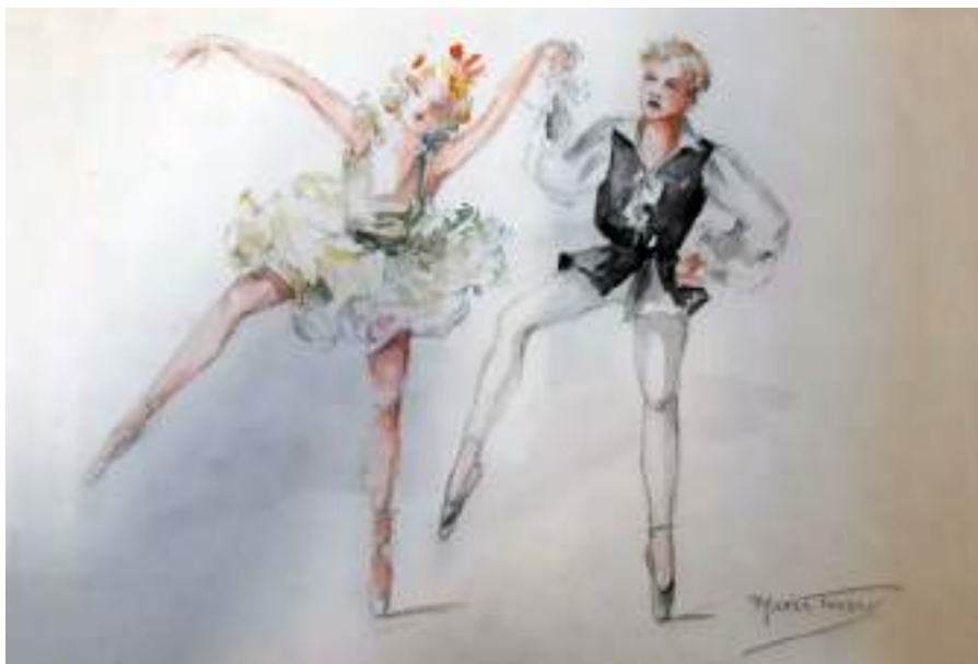
Ballets russos, c. 1948. Llapis i aquarel·la s/p, 25 x 30 cm.