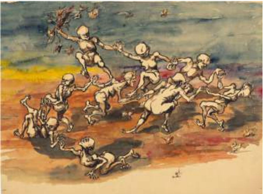
Dansa de bruixes i bruixots. Llapis i aquarel·la s/p, 42,5 x 57,5 cm.