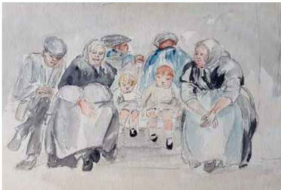
Asseguts al banc. Dones i avis amb infants. Llapis i aquarel·la s/p, 21 x 61 cm. Museu de Valls.