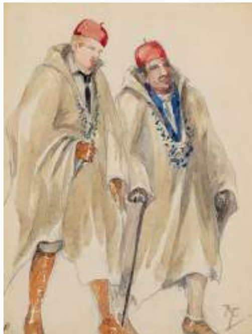
Membres de la Guàrdia mora. Llapis i aquarel·la s/p, 17,5 x 13,5 cm.