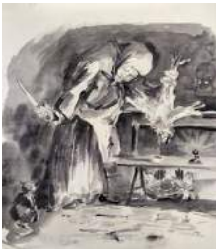
Bruixa a una cuina. Aiguada s/p, 31,5 x 24 cm.