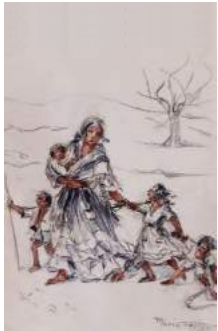
Dona gitana amb quatre infants. Llapis, carbonet i aquarel·la sobre cartolina 34,5 x 25 cm.