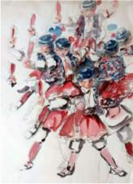
La moixiganga de Valls. Llapis i aquarel·la s/p, 26,5 x 17,8 cm. Museu de Valls.

Maria Freser, atenta sempre al que passava al seu entorn, ens dibuixa les festivitats tradicionals, tant civils com religioses. Els seus dibuixos aquarellats ens porten a les festes majors en què podem veure balls de bastons, la Moixiganga de Sitges, els balls dels envelats; i també ens mostren les celebracions religioses, com les processons de Setmana Santa de Tarragona o l'Escolania de Montserrat.