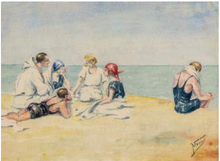
La platja de Vilassar de Mar. Llapis i aquarel·la s/p, 25,5 x 35,5 cm.