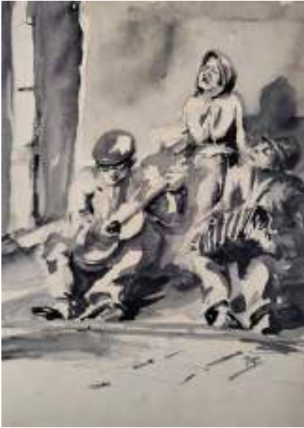
Músics ambulants. Aiguada s/p, 24 x 18 cm.