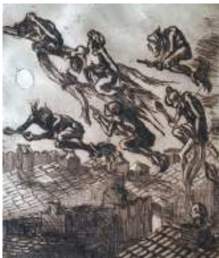
Brujas. Aiguafort, 18 x 23 cm. Museu de Valls.