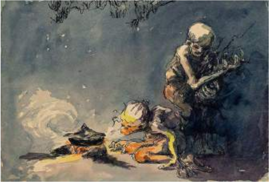
Bruixes bufant el foc. Llapis i aquarel·la s/p, 16,5 x 24 cm.