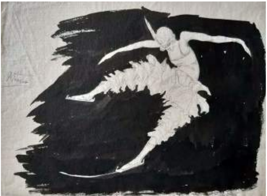
Ballet sobre gel. Llapis i tinta xina s/p, 23,5 x 30 cm.