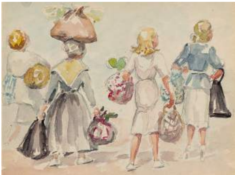
Dones tornat del mercat . Llapis i aquarel·la s/p, 23,6 x 33 cm.