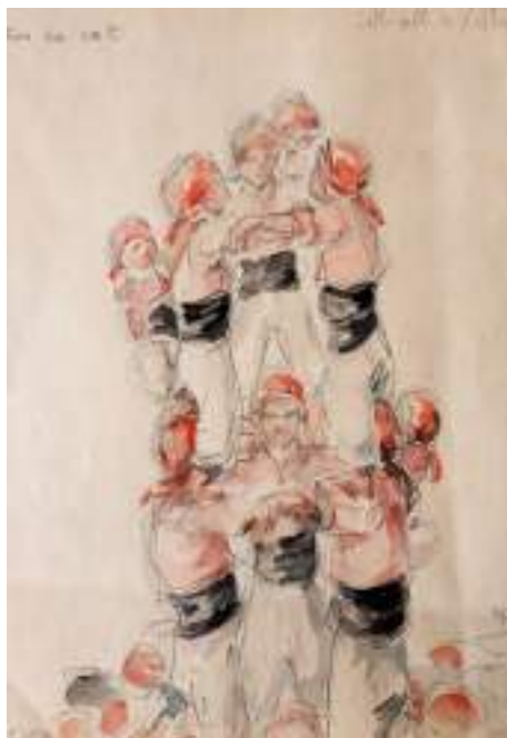
Tres de ser. Colla vella de Valls. Llapis i aquarel·la s/p. 24,1 x 20,7 cm. Museu de Valls.