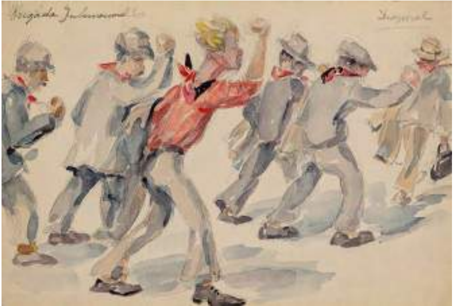
Brigades Internacionals. Diagonal. Gener 1937. Llapis i aquarel·la s/p, 13,5 x 20,5 cm.