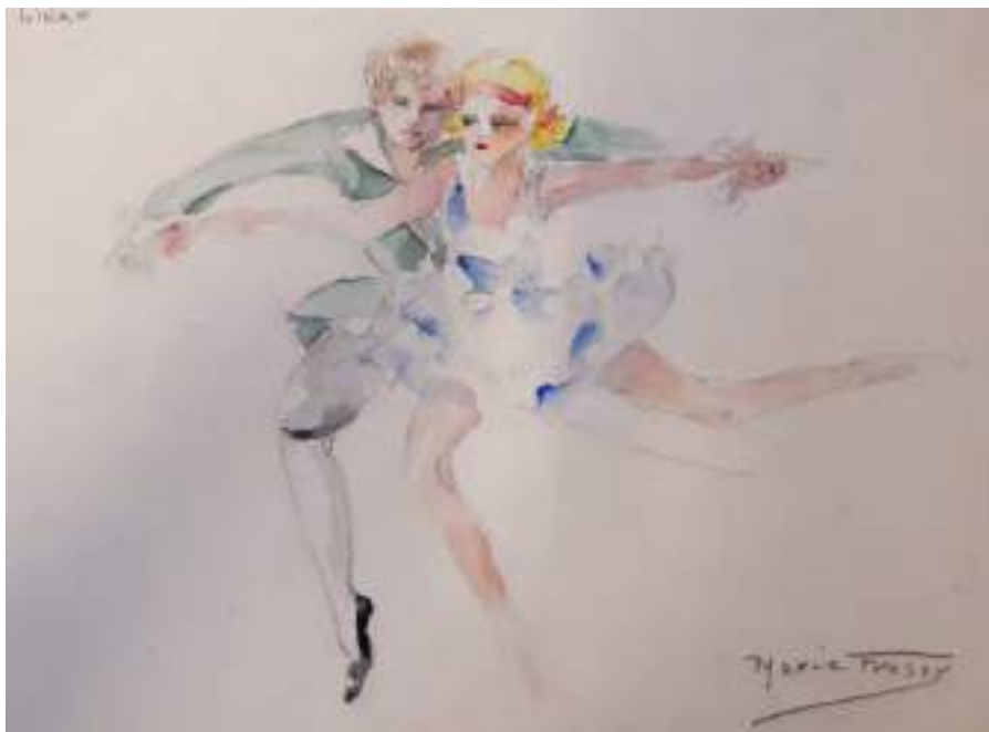
Ballets russos. Liceo. Llapis i aquarel·la s/p, 25 x 30 cm.