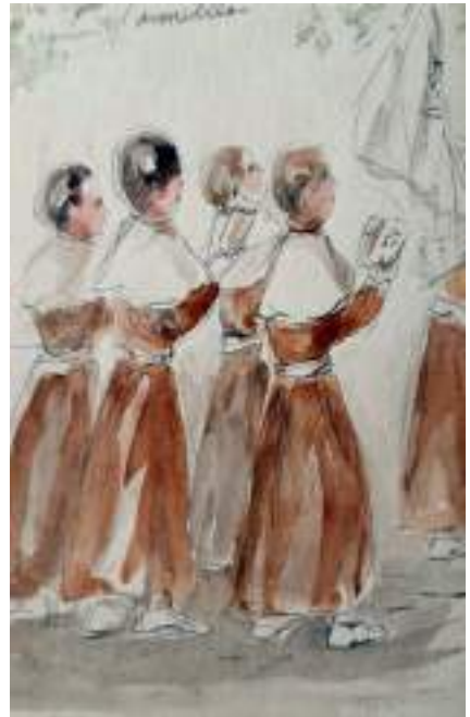
Escolanets a la processó de Setmana Santa, "Carmelites". Llapis i aquarel·la s/p, 17 x 12,5 cm.