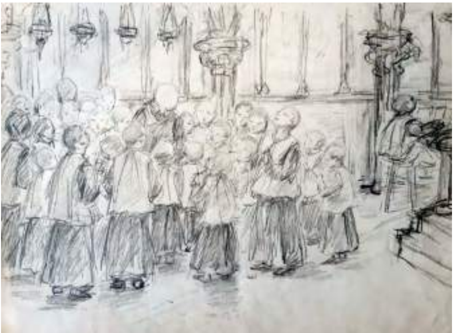
Escolans de Montserrat. Projecte per a gravat. Llapis s/p, 22,5 x 31 cm.