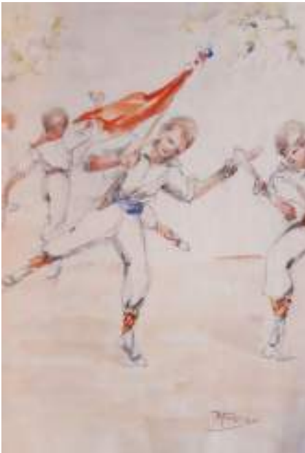
Ball de bastons. Llapis i aquarel·la s/p, 23,5 x 16,7 cm. Museu de Valls.