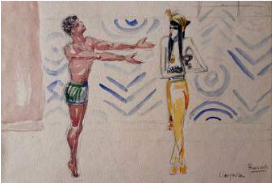
Cleòpatra, Russos, 1924. Llapis i aquarel·la s/p, 23, 5, x 32 cm.