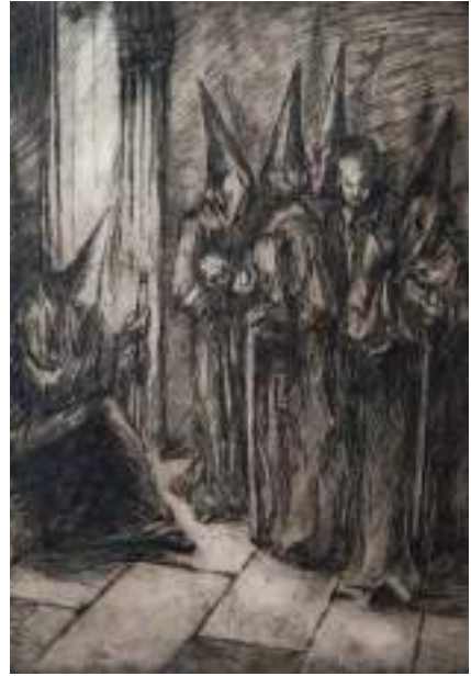
Penitents a la porta de l'església. 1923. Aiguafort. 38 x 29,5 cm.