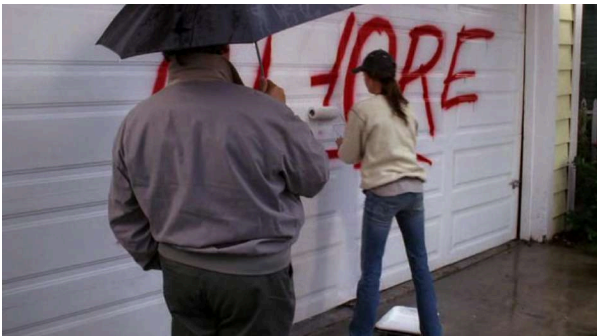
Obra de Les Frères Ripoulain (fotograma de la pel·lícula 'The Edge of Seventeen', de Kelly Fremon Craig, 2016)

L'exposició "Evasions. De la calle com a ficció" ofereix al visitant una pausa creativa i reflexiva, allunyada de les dinàmiques contemporànies dominades pel consum mediàtic i les xarxes socials. A través de l'art urbà i el graffiti, es proposa una exploració de les tensions entre l'autonomia artística i la seva integració en la cultura majoritària, tractant temes com la hipermercantilització, la interacció amb les noves tecnologies, l'assimilació per part del "mainstream" o el vandalisme conceptual, totes pràctiques profundament vinculades a l'expansió de subcultures i contracultures urbanes.