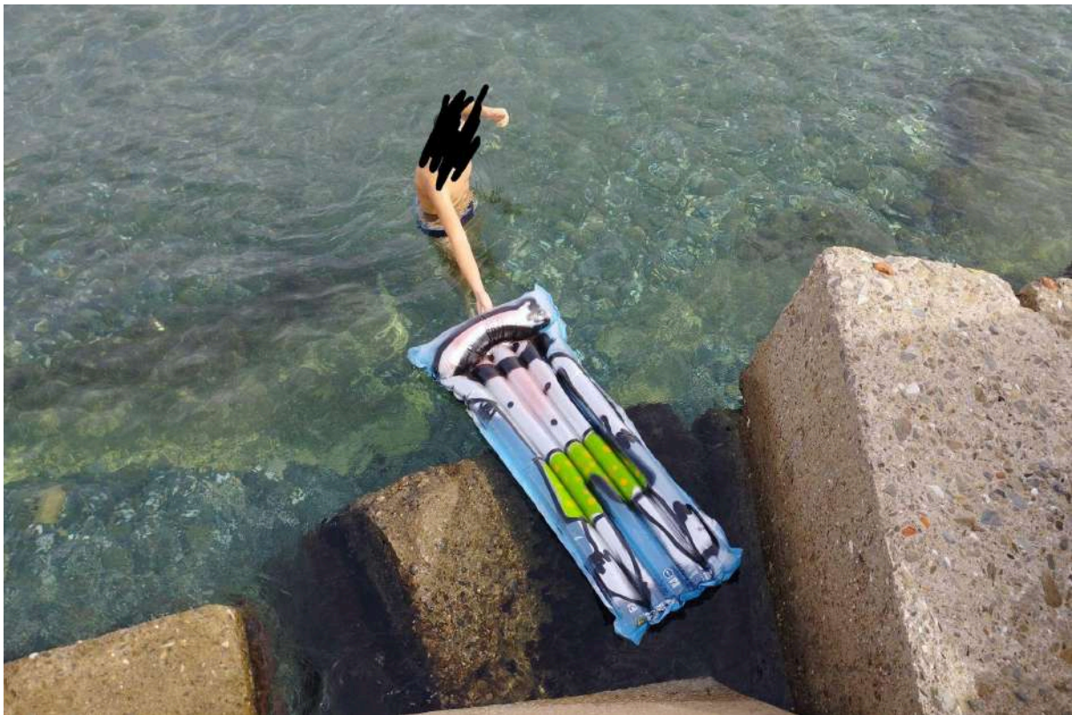
Obra de Yoni

INDAGUE és l' Asociació Espanyola per a la Investigació i Difusió del Graffiti i l'Art Urbà , dedicada a l'estudi i documentació d'aquestes manifestacions creatives, especialment les no regulades en l'espai públic. Els seus objectius inclouen aprofundir en els aspectes històrics, culturals, estètics i polítics del graffiti i art urbà, millorar els mètodes pedagògics i de conservació de les obres, promoure projectes col·laboratius i consolidar una xarxa de recursos que impulsi la recerca a nivell estatal. A més, busca establir-se com un referent entre les escenes artístiques i els àmbits acadèmics, fomentant relacions amb altres organitzacions i institucions afins.