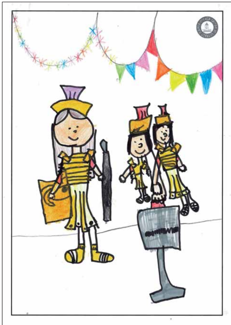
Júlia Masachs. 15 curs